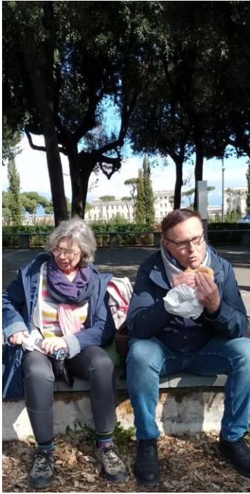
Les professeurs aussi ont besoin de prendre des forces !