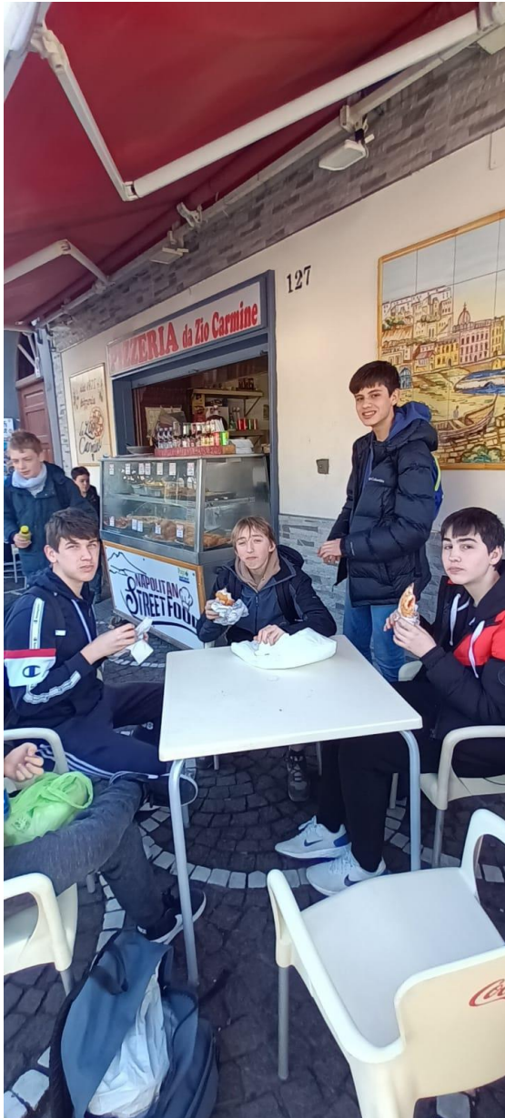
Les 3 èmes , plus pragmatiques, ont choisi la solution de facilité !