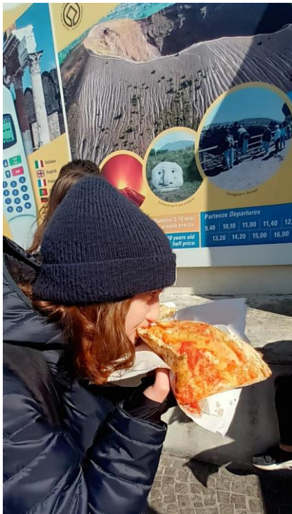
Certaines s'en tirent plutôt bien !