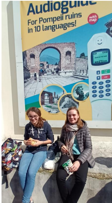
De l'art difficile de manger une pizza en plein air...