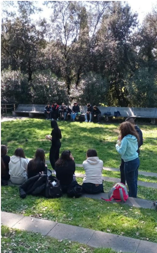
Tentative de socialisation avec des autochtones... On s'observe...

Et c'est parti pour la visite du site ! Le forum a visiblement enthousiasmé les 5 èmes et les 4 èmes !