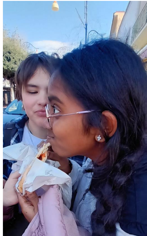
Les Léa semblent ravies !